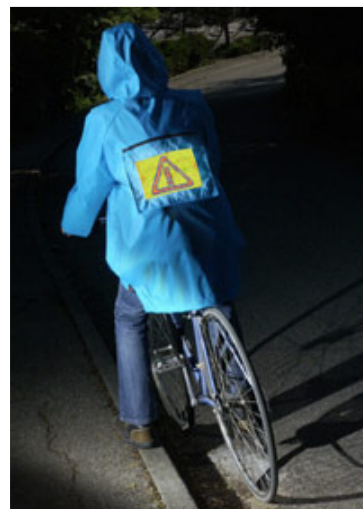
2. ábra. Képernyő a ruhán (France Telecom)

A 3. ábrán látható „HugJacket”-ből (az angol „hug” szó jelentése: átölelés) kettő alkot egy párt. Ha ezek viselői összeölelkeznek, működésbe lépnek a mintázatban elhelyezett LED-ek és a szívdobogást imitáló hangjelzők. Az érzékelő mintázatot vezetőképes kelméből készítik és rávarrják a ruhadarabok elejére. Ha a két ember összeölelkezik, ezek a mintázatok érintkezésbe lépnek és aktiválják egymást. A két ruhadarab azonos mintázata közösen alkotja azt az áramkört, ami a működéshez szükséges, így idegen ember ölelésére, aki másféle mintázattal mellényt hord, természetesen nem reagálnak, az összetartozókat vi-